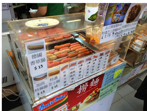
位於3樓的小食店以低價作招徠。