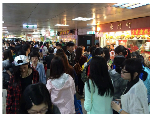
星期日的葵涌廣場人來人往。

在香港這個標榜經濟發展的城市，要發展獨特且具有人情味的店鋪十分困難。在租金高昂的情況下，只有大財團及連鎖店能夠負擔營運成本。近年市民不斷強調集體回憶及人情味，但隨著重建項目的推行，香港具有特色的店鋪及商場買少見少。要蘊釀人情味，並不是多逛幾次商場，多買幾件商品就做到的事。若每個人都從身邊的人開始，多對話，多交流，香港自然就充滿濃厚的人情味。